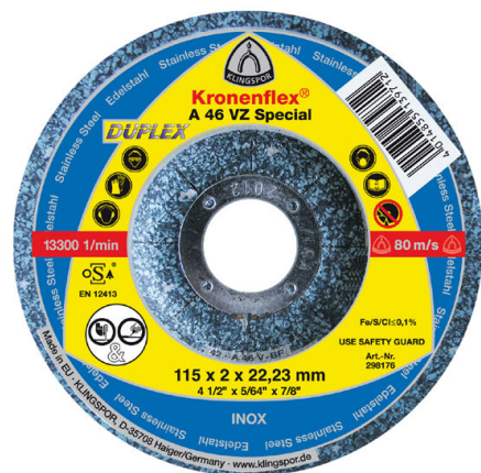
A 46 VZ SPECIAL